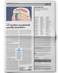
MORGENBLADET 16. FEBRUAR 2018

jakt på mer. Den kontinuerlige sammenligningen med glansbilder i sosiale medier som presses på alle, gjør misnøyen og skammen større enn noen gang.